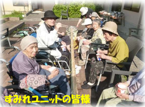
すみれユニットの皆様