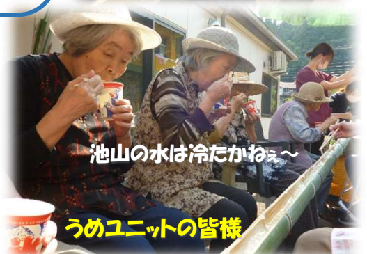
池山の水は冷たかねえ～