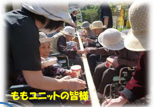
ももユニットの皆様