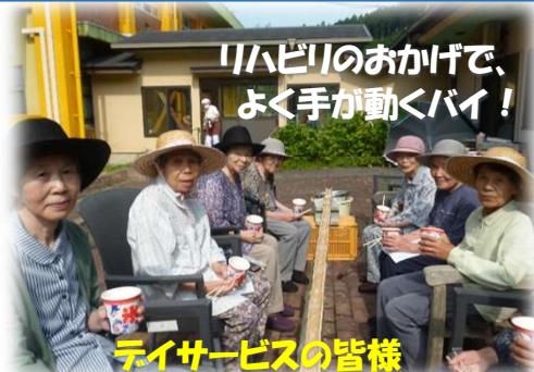
リハビリのおかげで、よく手が動くバイ！