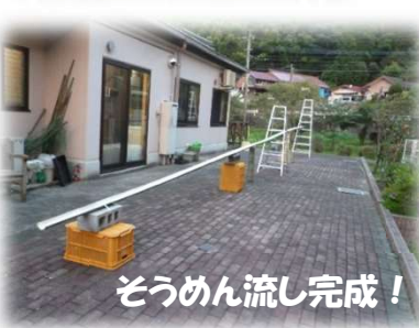
そうめん流し完成！