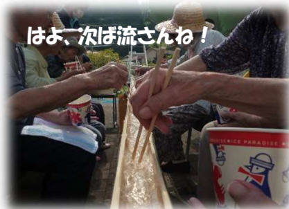
はよ、次ば流さんね！